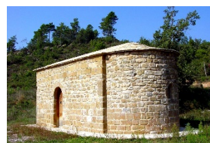
Santa Eulàlia de Pomanyons Rialb Jussà, Visitable