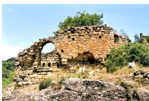
Sant Pere de Vilamonera En ruïnes, Rialb Jussà