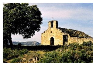
Sant Pere del Soler Privades, Rialb Jussà