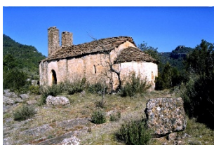
Sant Salvador de Mas Barrat Privades, Rialb Sobirà