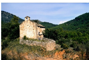
Santa Maria de Ramoneda Privades, Rialb Sobirà