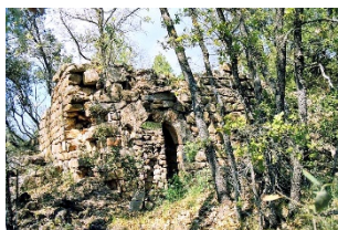
Sant Miquel de Treguany En ruïnes, Rialb Sobirà