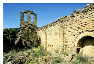
Santa Maria del Castell de Salinoves En ruïnes, Rialb Sobirà