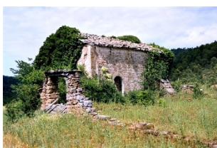
Sant Miquel de Mas Palou Privades, Rialb Jussà