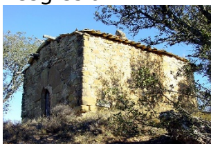
Sant Vicenç de les Cases de Rialb Privades, Rialb Sobirà

Trobareu més informació al web de l'Ajuntament o picant sobre el nom de l'església.