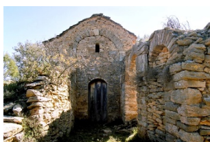
Sant Sebastià de Cerdanyès En ruïnes, Rialb Sobirà