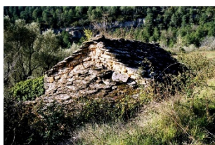
Santa Anna de Fabregada En ruïnes, Rialb Sobirà