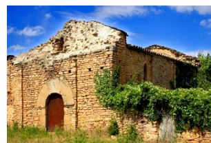
Sant Jaume de Sant Cristòfol de la Donzell En ruïnes, Privades, Rialb Sobirà