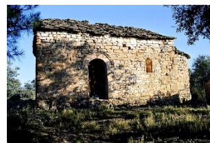
Sant Ponç de Martimà Privades, Rialb Sobirà