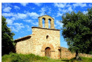
Sant Serni de Bellfort Rialb Sobirà, Visitable