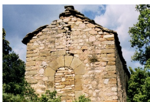
Sant Marc de Pallerols Privades, Rialb Jussà