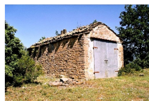
Sant Pere de la Donzell Privades, Rialb Sobirà