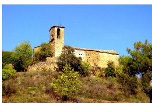
Sant Andreu del Puig Rialb Sobirà, Visitable